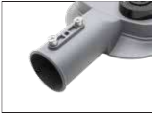
Ponta de braço.