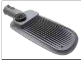
Aletas em alumínio para distribuição e dissipação de calor.