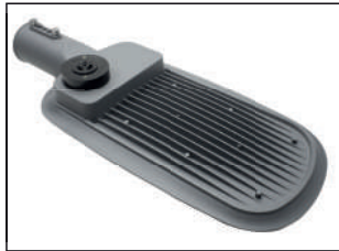
Aletas em alumínio para distribuição e dissipação de calor.