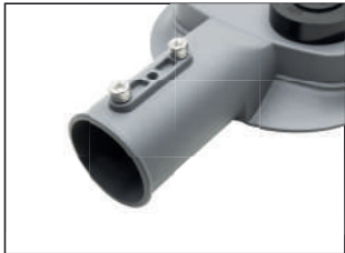
Ponta de braço.